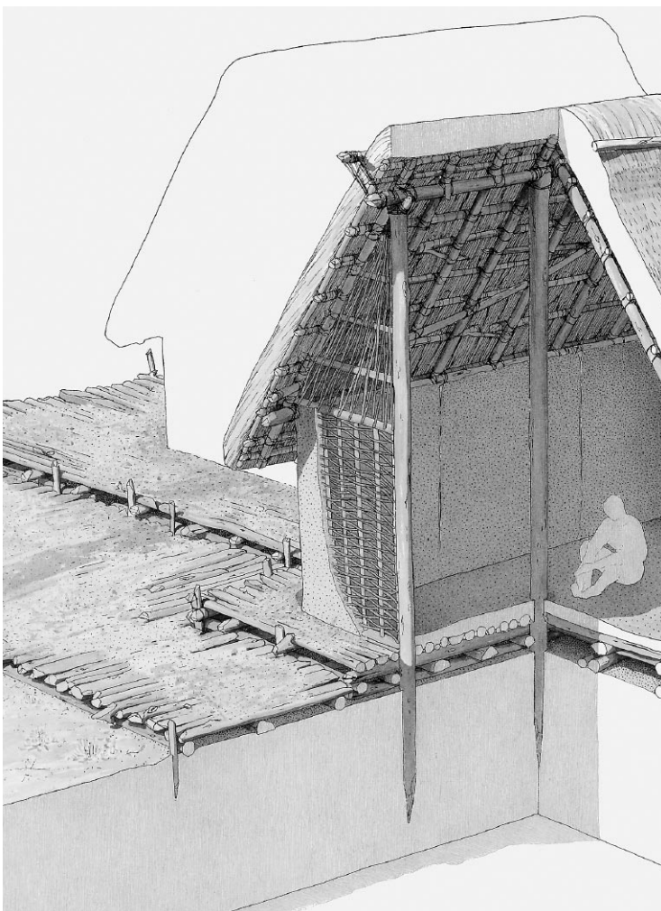
Rekonstruktion eines neolithischen Hauses mit leicht erhöhtem Prügelboden

Ausstellungskonzept und -realisierung: Archäologischer Dienst des Kantons Bern (P.J. Suter und A. Hafner) mit internen und externen Mitarbeiterinnen und Mitarbeitern (Inhalt und Grafik); E. Zollinger und Haupt AG (Stellwände und Schriften).