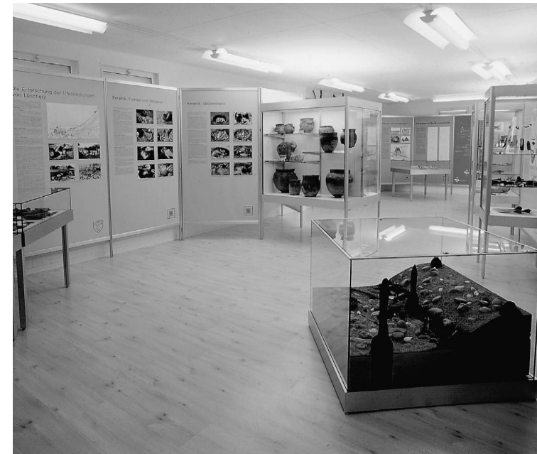
Blick ins Pfahlbaumuseum Lüscherz

Die Zeittafel fixiert einige kulturgeschichtlich wichtige Daten unserer Region im Vergleich mit den Kulturen des Mittelmeerraumes.